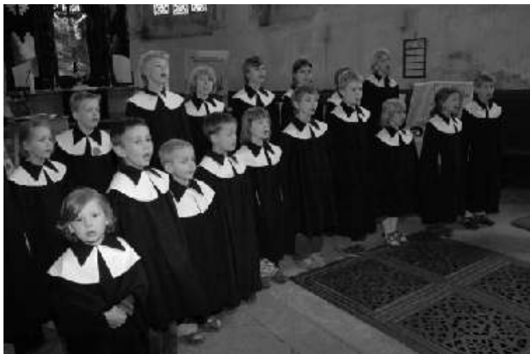
Auftritt der Innenstadtkurrende

mit seiner Harfe, David als Schafhirte, Saul in seinem Sessel und weiteren künstlerisch gestalteten Bildern zur biblischen Geschichte. Musikalisch wurde das Bibelfest durch Bläser, Gemeindegesang, Orgelmusik und Beiträge der Vorkurrende und der Kurrende gestaltet. Die beiden Kurrendegruppen sangen ein kleines weltliches Programm: vier Chorlieder trugen die "kleine" und die "große" Kurrende gemeinsam vor; mit vier weiteren Chorliedern beschloss die "große" Kurrende den halbstündigen Auftritt.