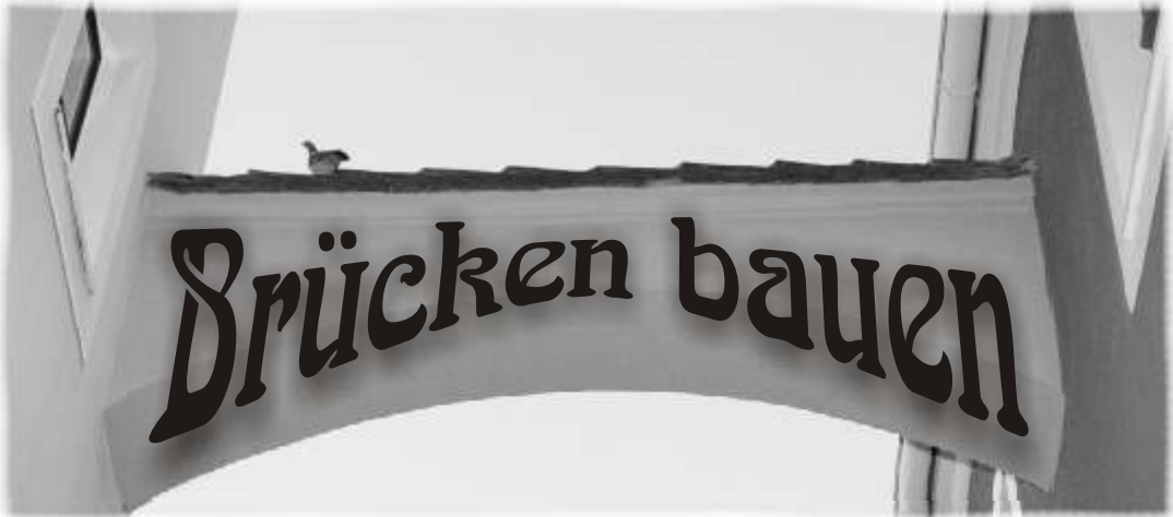
Gemeindeblatt der Evang. Innenstadtgemeinde Görlitz